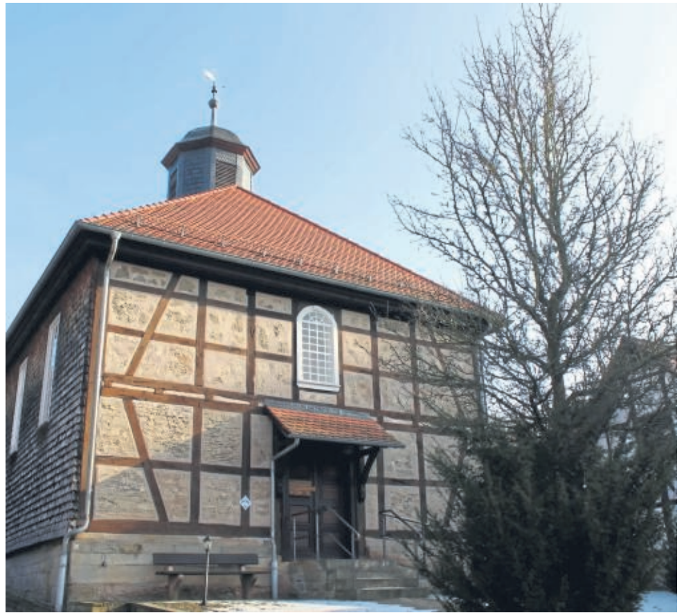
Sehenswertes Etappenziel: Auch die alte Kirche in Markershausen liegt auf halben Weg der Wanderstrecke auf dem Werra-Burgen-Steig.